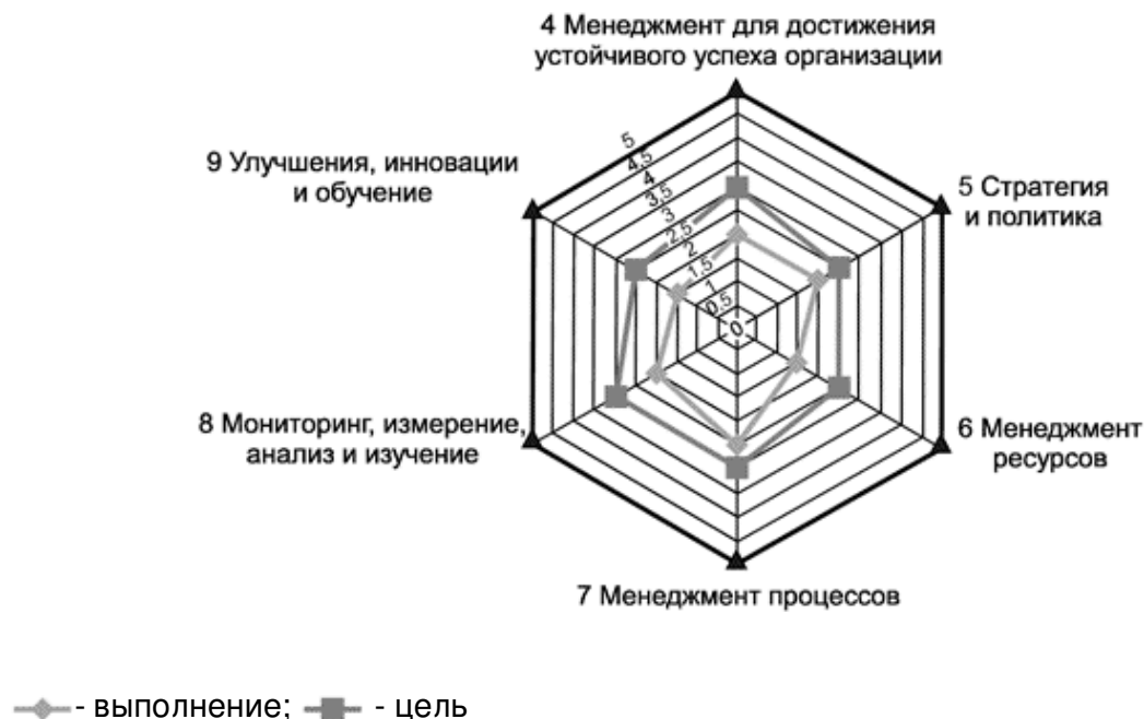
Рисунок А.2 - Иллюстрация результатов самооценки

Организация может характеризоваться разными уровнями зрелости по каждому из элементов. Анализ расхождений может помочь высшему руководству в планировании и определении первоочередных мер по улучшению и (или) инновационных инициатив, необходимых для перевода отдельных элементов на более высокий уровень.