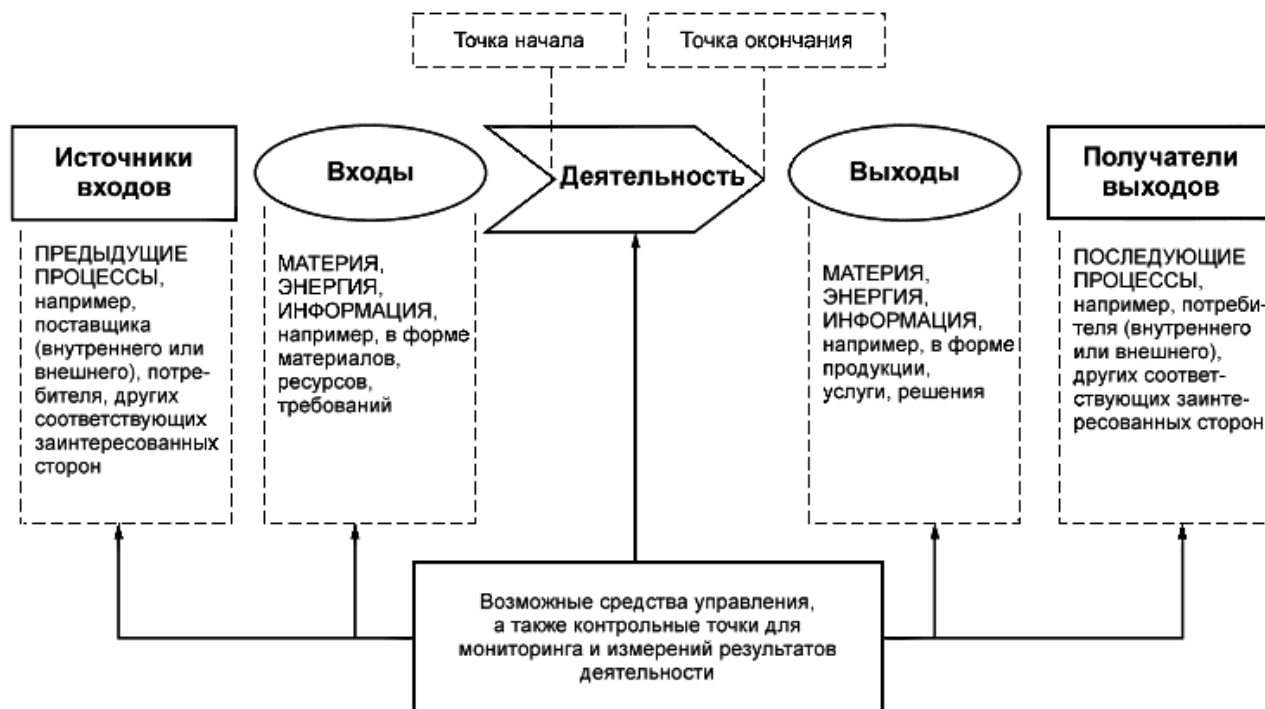
Рисунок 1 - Схематичное изображение элементов процесса

Рисунок 1 дает схематичное изображение любого процесса и иллюстрирует взаимосвязь элементов процесса. Контрольные точки мониторинга и измерения, необходимые для управления, являются специфическими для каждого процесса и будут варьироваться в зависимости от соответствующих рисков.